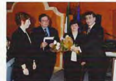
Famiglia Kiwaniana di una lunga e fattiva esperienza nel Club. Nella stessa serata, alla presenza dello Youth Governor del